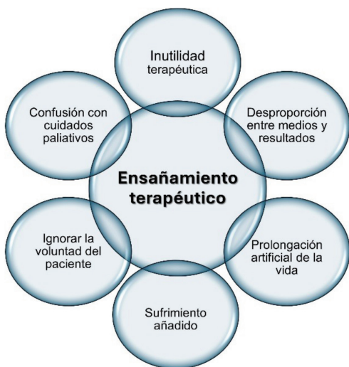
Figura 2. Principales características del ensañamiento terapéutico.

Como se mencionó anteriormente, el ensañamiento terapéutico consiste en la aplicación de medidas médicas no indicadas, desproporcionadas o extraordinarias, con el fin de evitar la muerte de un paciente con una enfermedad terminal o irreversible. Sus principales características se muestran en la Figura 2.