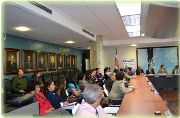
Funcionarios que asistieron a la clausura de la Cátedra

compromiso participaron en la organización de las actividades conmemorativas .