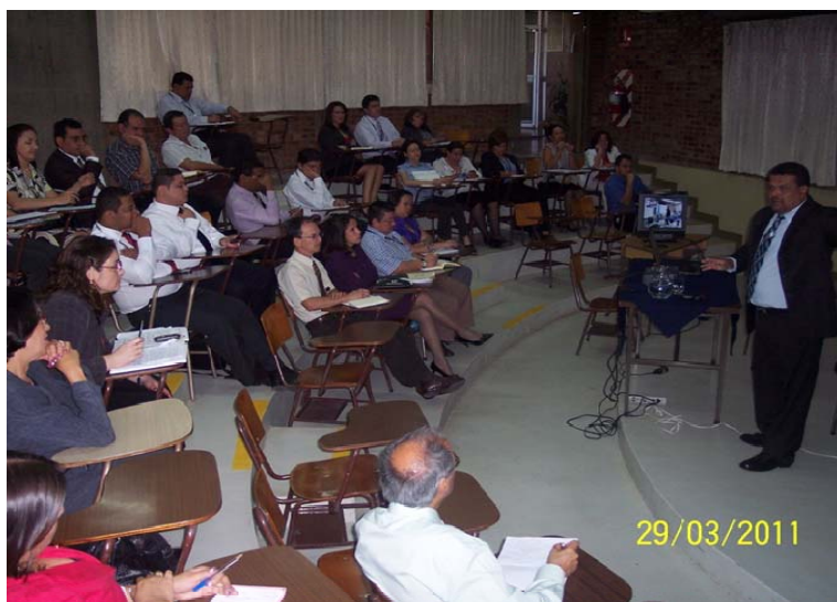
Grupo de funcionarios durante una de las actividades educativas de la Cátedra en CENDEISS

Este curso a cargo de la Subárea de Desarrollo Profesional del CENDEISS, estuvo orientado a personal de los servicios de salud, vinculados con la Gestión de Personal especialmente de quienes tienen a cargo los cursos de Inducción u otras actividades relacionadas con los Recursos Humanos. Es un curso de participación con una duración de tres días, y revisa los principios de la seguridad social y sus perspectivas, desde el ámbito de los derechos y deberes, tanto de los funcionarios como de las personas que reciben los servicios. Se realiza un repaso de la historia de la seguridad social, de la evolución del Estado costarricense en materia de protección a los derechos y garantías sociales e individuales. Los participantes tienen la oportunidad de expresar sus experiencias laborales y, a partir de ellas, visualizar las perspectivas de nuestro sistema de seguridad social. Fecha de la actividad: del 9 al 11 de febrero de 2011 ( un primer grupo ) y del 13 al 15 de julio 2011 ( un segundo grupo ) .