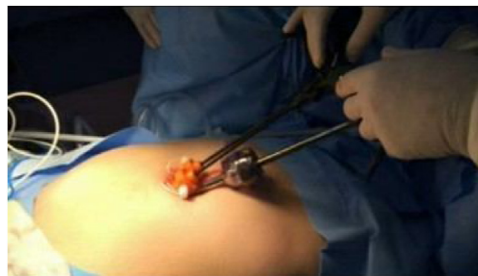
Figura 1 Acceso transumbilical por puerto único con trócares convencionales.

Durante la intervención se utilizó la óptica de 10 mm excepto cuando se realizó la técnica del ganglio centinela, que se utilizó la óptica de 5 mm para poder introducir la sonda de la gammacámara por el trocar de 10 mm. En los casos en los que hubo que realizar linfadenectomía paraaórtica (3 casos por tener un grado de diferenciación G3 y otro por ser un sincrónico con un carcinoma de ovario), se realizó de forma extraperitoneal al inicio de la intervención en un caso, y en los otros 3 casos se realizó tras la histerectomía y linfadenectomía pélvica. Tras extraer el útero y los ganglios pélvicos se suturó parcialmente la vagina, dejando la parte central abierta para introducir un trocar de balón, el