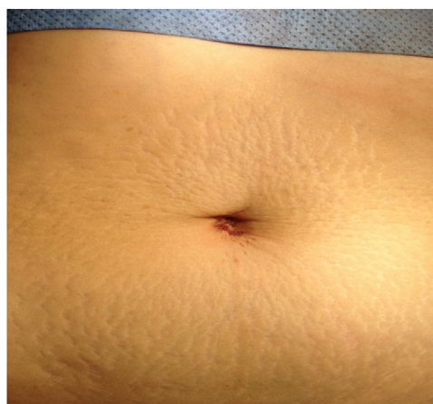
Figura 3 Resultados estéticos II.