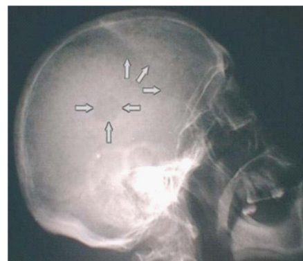
Figura 2. Lesión osteolítica “en sacabocado” característica de la enfermedad

Permite descubrir las típicas imágenes osteolíticas redondeadas en “sacabocados”, casi siempre múltiples y más evidentes en la calota craneal, que indica las zonas de diploe invadidas por los focos mielomatosos. En la columna vertebral son típicos los aplastamientos vertebrales en “emparedado” o en “cola de pescado”. En las escápulas, las costillas y la pelvis, pueden observarse unas imágenes que simulan un apollillado (en “nido de abejas”). Los huesos largos suelen presentar focos osteolíticos bien definidos.