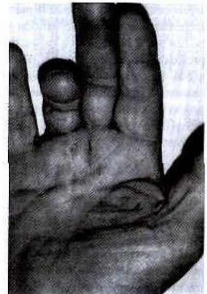
Figura 1. Fase más avanzada. Se forma una banda de retracción prominente en dirección del dedo anular, por debajo de la piel palmar. Existe limitación de la extensión a nivel de la articulaciones metacarpofalángica e interfalángica proximal.

Definición: Es una enfermedad progresiva, caracterizada por fibrosis, seguida por engrosamiento y acortamiento de la aponeurosis palmar y sus prolongaciones digitales; se considera un desorden fibroproliferativo 1,8 .