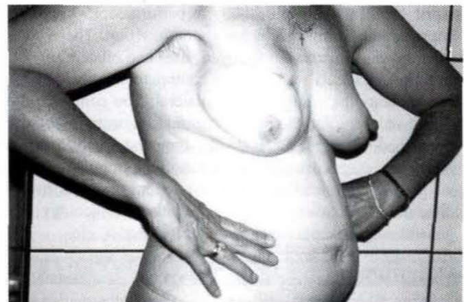
Figura 1: Postoperatorio de reconstrucción mamaria con colgajo TRAM