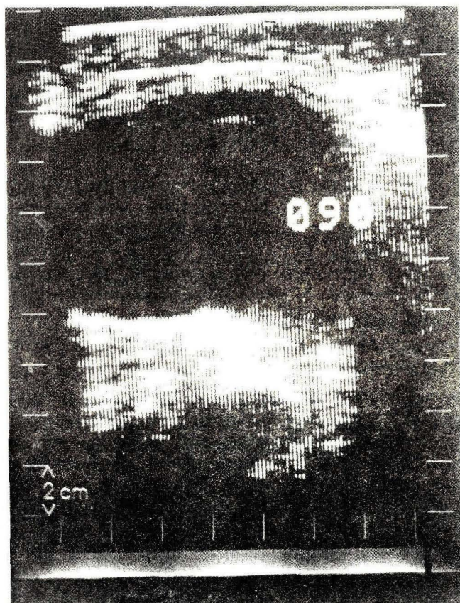
Figura No. 2

Ultrasonido que muestra gran masa quística correspondiente a un pseudoquiste pancreático.