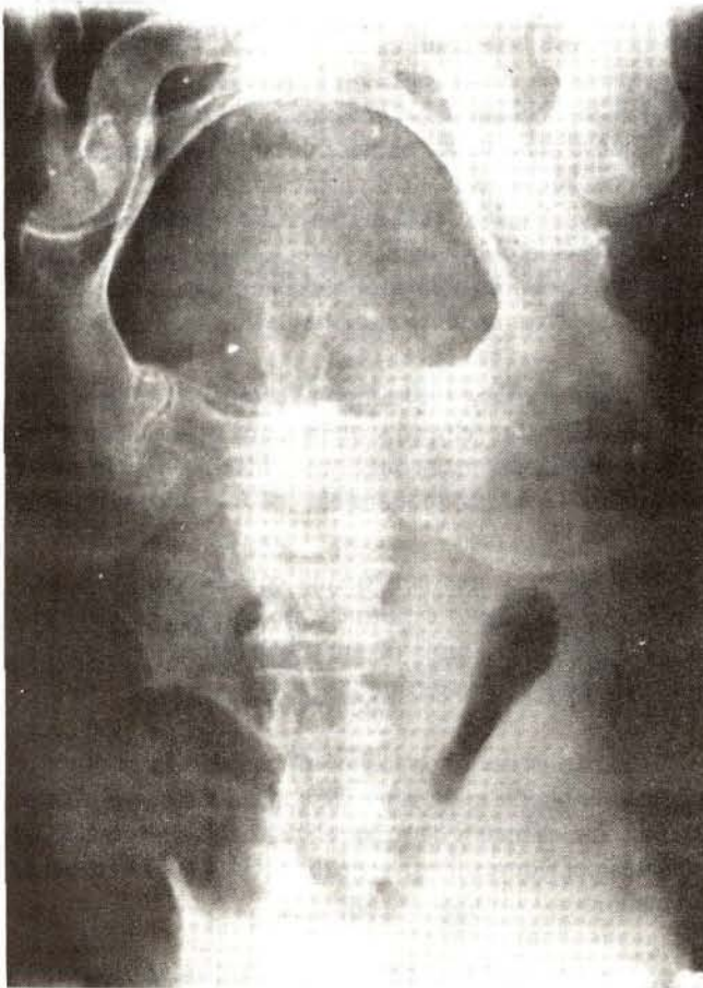
Placa simple de abdomen mostrando aire en la vesícula