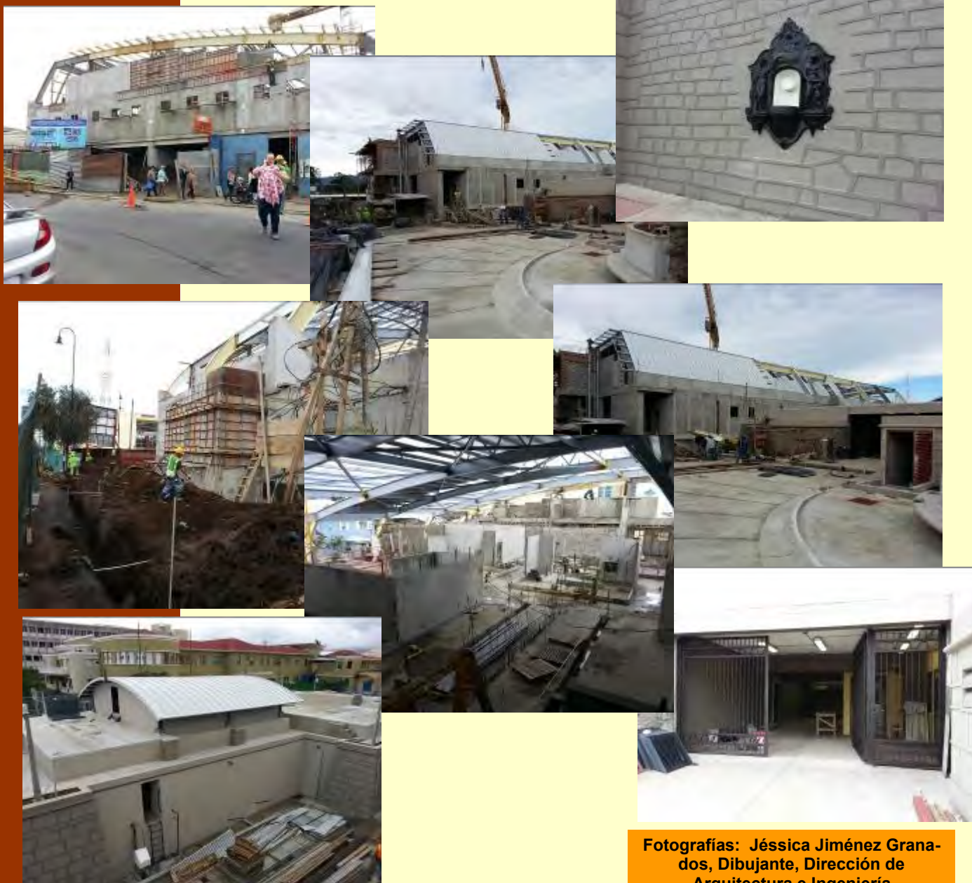
Fotografías: Jéssica Jiménez Granados, Dibujante, Dirección de Arquitectura e Ingeniería

A continuación les presentamos una serie de fotografías sobre los avances del proyecto del Servicio de Nutrición y Ropería para su conocimiento: